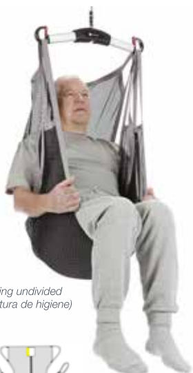
FlexibeSling undivided (Sin apertura de higiene)