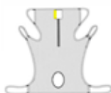
FlexibeSling, Undivided (con apertura de higiene)